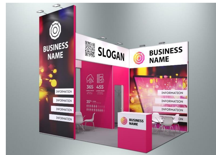
Пример оформления стенда с полноцветным оформлением поверхностей (дополнительная услуга)