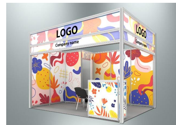
Пример оформления стенда с полноцветной оклейкой поверхностей (дополнительная услуга)