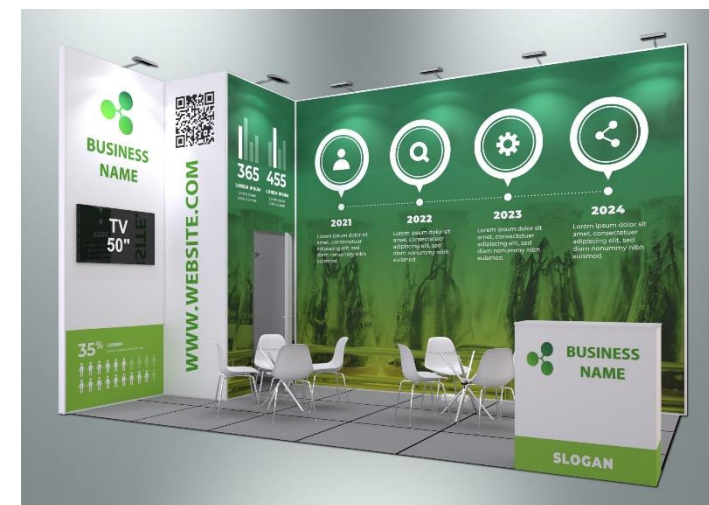
Пример оформления стенда с полноцветным оформлением поверхностей (дополнительная услуга)