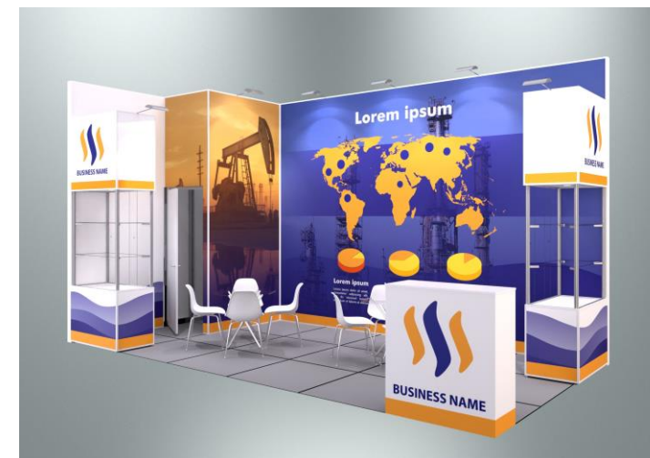
Пример оформления стенда с полноцветным оформлением поверхностей (дополнительная услуга)