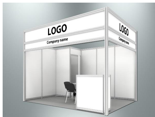
Пример стандартного оформления стенда

Стенд будет находиться в окружении ключевых игроков отрасли в местах с самым большим трафиком посетителей.